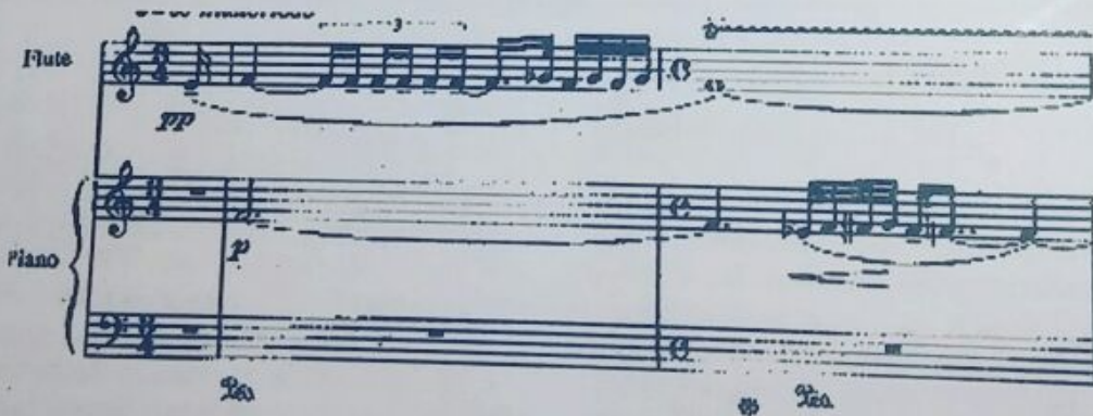
Şəkil 3. 1-3 xanələr. Fleytada olan passajlar

Əsər sakit və ağır girişlə başlayır, ekspozisiyada Fleyta və fortepianoda səslənən trellər, pasajlar əsərin xarakteristik strukturunu sərgiləyir. Fleytada səslənən passajlar ney səsini xatırladır.